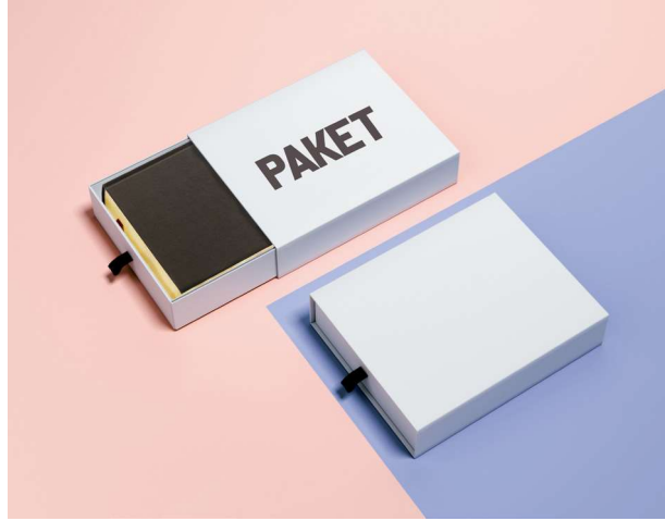
Görsel 4.2: Değişken adı ve değeri

Sabit kavramı ise uygulama çalıştığı sürece değeri değişmeyen veriler olarak ifade edilebilir. Örneğin bir inç 2,54 cm'dir. Bu gibi değeri değişmemesi gereken veriler sabit olarak tanımlanabilir.