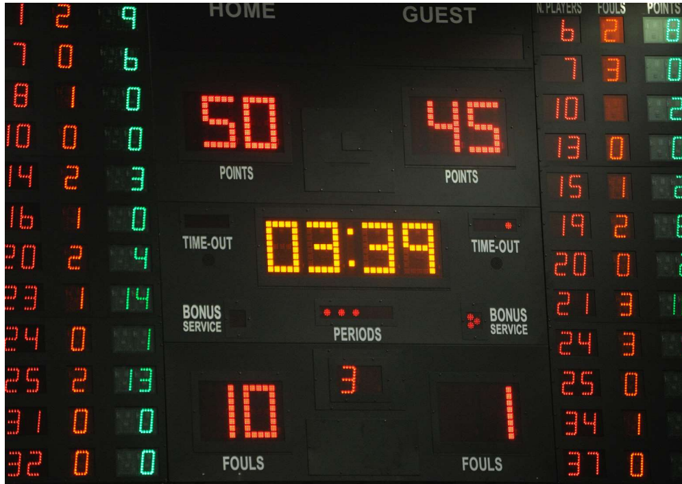
Görsel 4.1: Değişken mantığı

Değişken kavramını anlayabilmek için günlük hayattan örnekler verilebilir. 12 Dev Adam'ın bir maçını düşünün. Maçın o anki skoru 47-45 12 Dev Adam lehine olsun. Burada 47 sayısı değişkenin o anki değeridir. Cedi Osman'ın attığı üç sayılık isabetli atıştan sonra değişkenin yeni değeri artık 50 sayısıdır.